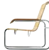
Marcel Breuer 1929