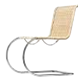
Ludwig Mies van der Rohe 1927